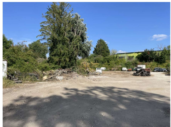
Situation au 15/07/2025