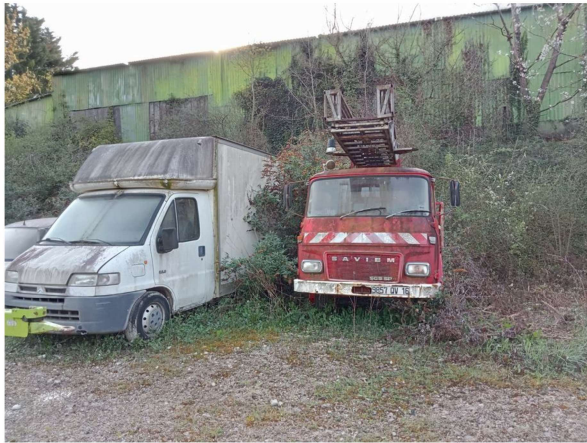
Situation au 11/06/2025