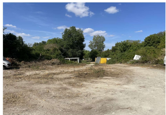
Situation au 15/07/2025