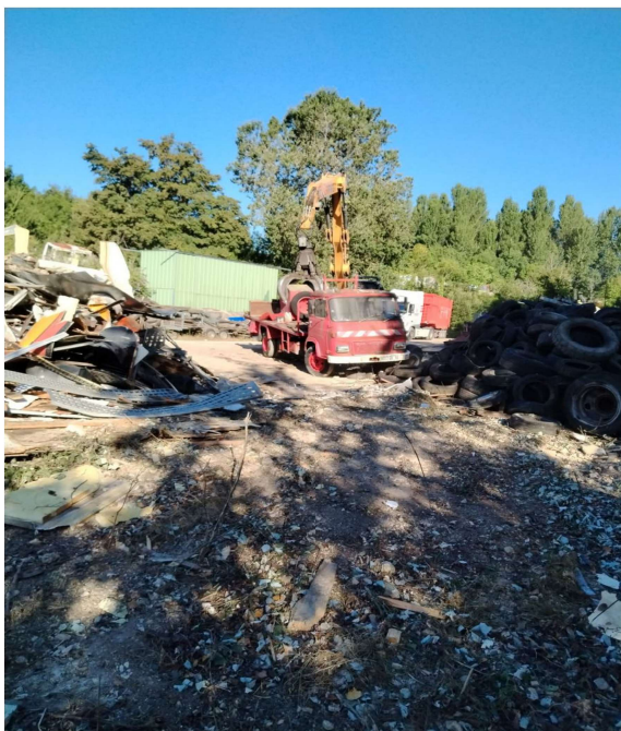
Opérations en cours du 7 au 11 juillet 2025