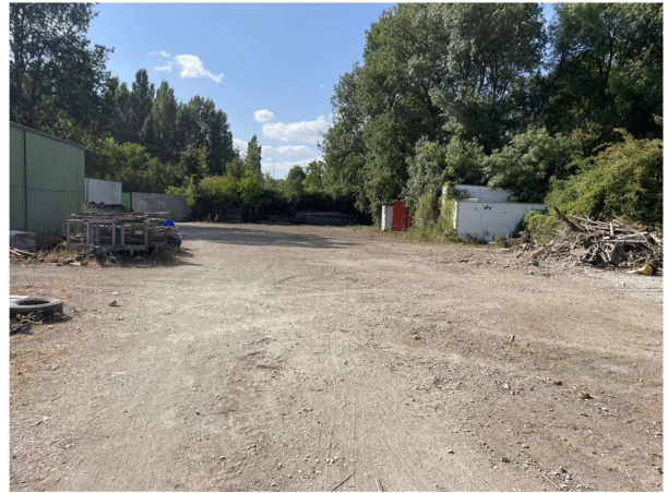
Situation au 15/07/2025