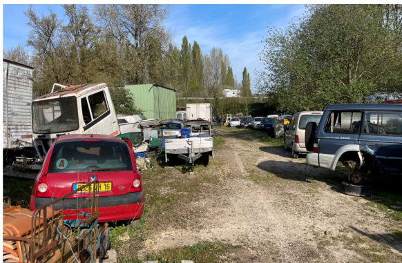
Situation au 11/06/2025